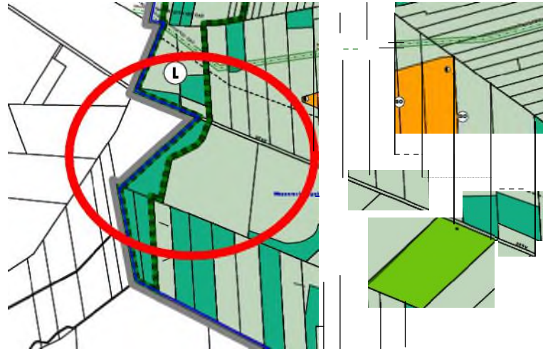
Abb. 2 Ausschnitt FNP Stadt Winsen(Luhe) mit Kennzeichnung des Alternativstandortes befindet sich im Wasserschutzgebiet (kein Hindernis)

Eignung abhängig von der Platzrunde des Flugplatzes Holtorfsloh: Bei Beibehaltung der Platzrunde Verlegung möglich, solange die Platzrunde nur im RROP dargestellt ist und nicht tatsächlich benötigt wird. Bei Verkleinerung der Platzrunde im RROP wird eine WEA hier her rücken, dann kann allerdings wahrscheinlich der alte Standort beibehalten werden.